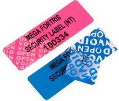
改ざん防止ラベル