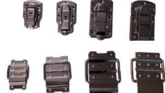
各種パッチン錠、丁番