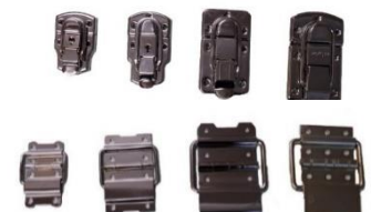
各種パッチン錠、丁番