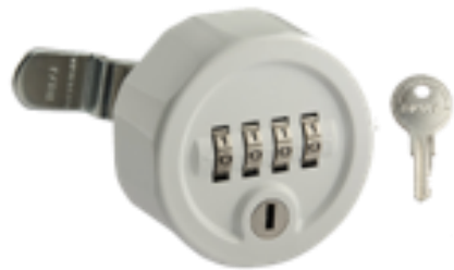
4桁ダイヤル錠＝高性能+非常解錠