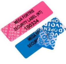
改ざん防止ラベル