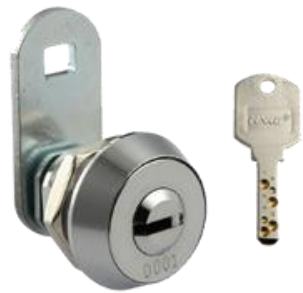
ハイセキュリティディンプルロック 鍵違い数：10,000通り以上