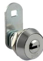
MT-114BSディンプルロック