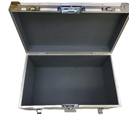
内装：メルトン貼タイプ